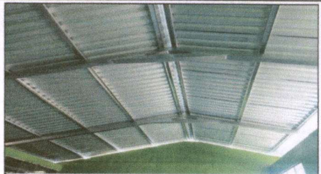
Foto 2: Sustitución de estructura de soporte de madera, por metal, 90ML