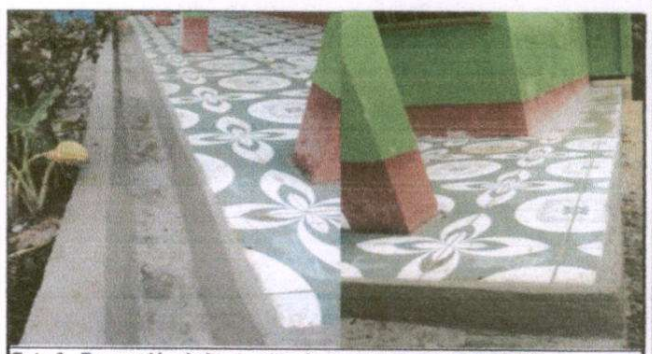
Foto 6 Reparación de banquetas de concreto y cunetas 16 M2

Observación: Si es necesario se pueden agregar hojas adicionales y número de hojas.