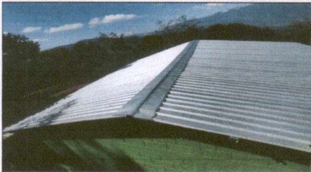
Foto 1: Sustitución de lámina, por lámina troquelada, 88 M2 . Sustitución de capote de lámina para lámina troquelada 4 ML